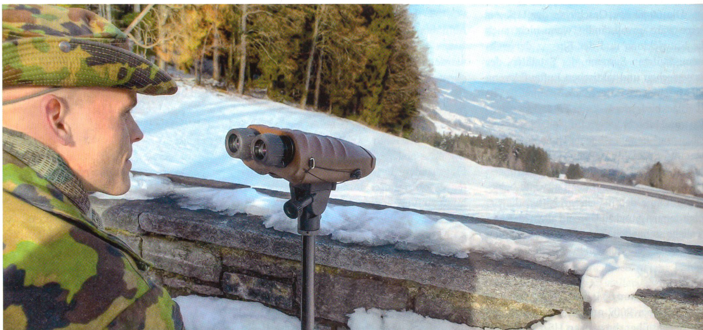
Ein Gerät vom Typ Vektor in einem Beobachtungsposten.