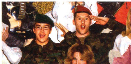
Von der Seite des Herzens.

Die ganze Schweiz singt: «Love is in the air», verkündet die Swisscom am Sonntag vor dem Silvester 2007 – und zeigt Dutzende Sängerinnen und Sänger. Es ist nett und verdienstvoll, dass die Swisscom auch