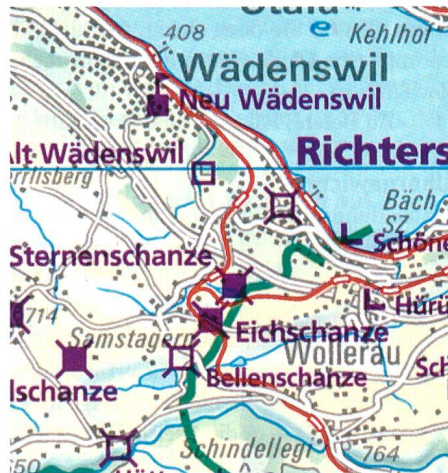
Burgen am Zürichsee.

Die neue Burgenkarte der Schweiz im Massstab 1:200 000 bietet Laien wie Fachleuten den Zugang zum richtigen Objekt am richtigen Ort. Sie liefert einen Überblick über den gesamten Bestand der Wehranla-