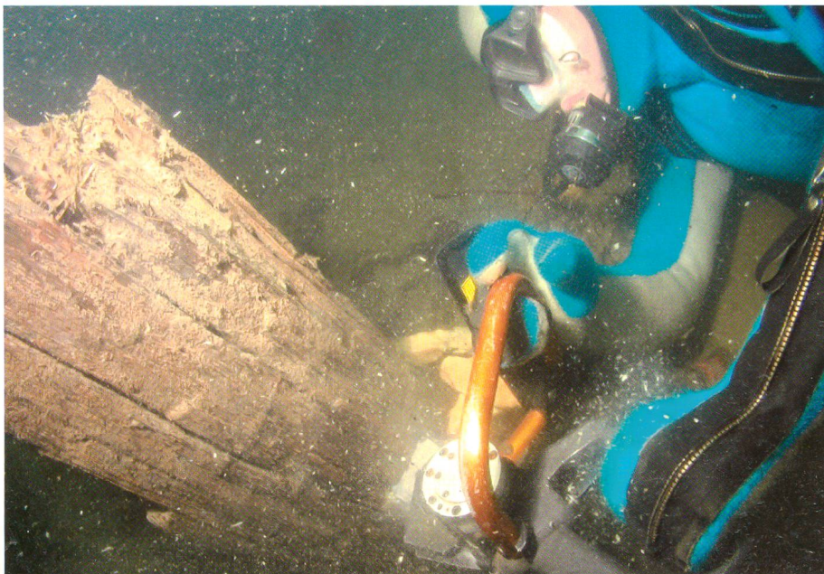
Armeetaucher im Unterwassereinsatz.

Mit dem 2007 von den Eidgenössischen Räten verabschiedeten Entwick-