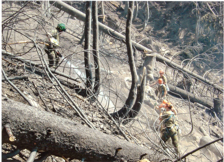
Waldbrand in Arbaz VS: Katastrophenhilfe bewährt sich.

Das Panzerbataillon 14 passierte die Emme bei Schalunen BE und Bätterkinden BE, zeitgleich überquerte das Panzergrenadierbataillon 29 die Thur bei Warth TG und Amlikon TG. Beim spektakulären Brückenbau war der Einsatz aller gefordert. Am Mittwoch, 30. Mai 2007 trafen gegen 20