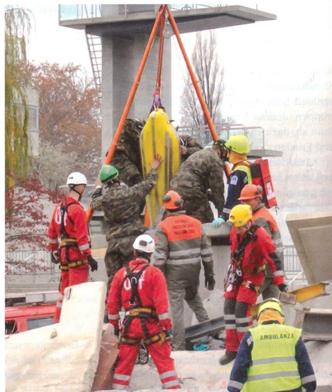
Einsatz von Rettungstruppen an den Armeetagen in Lugano.