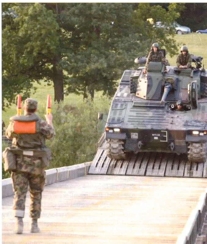
Kombibrücke (FB 69 / STB 95) über die Thur bei Warth TG.

Der bekanntlich extrem trockene April 2007, führte in den Kantonen Tessin und Wallis zu akuten Waldbränden. Am Montag, 16. April erhielt das Einsatzkommando Katastrophenhilfe-Bereitschaftsverband (Ei Kdo Kata Hi Ber Vb) den Einsatzbefehl, der