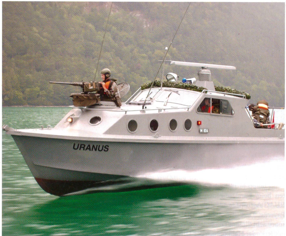
Das Pont Bat 26, die Mot Bootkp 10 und auch die Ing Stäbe bleiben dem LVb G/Rttg unterstellt.

Auch aufgrund dieses Entwicklungsschrittes wurde durch mich folgende Vision formuliert: «Die Lehrbrigade Genie/Rettung ist das Ausbildungszentrum und der Force Provider für Genie/Rettung der Armee. Sie bildet alle Angehörigen der Genie- und Rettungstruppen aus und garantiert einen einheitlichen Ausbildungsstand aller Truppenkörper und Einheiten der Genie/Rettung. In der Brigade sind alle