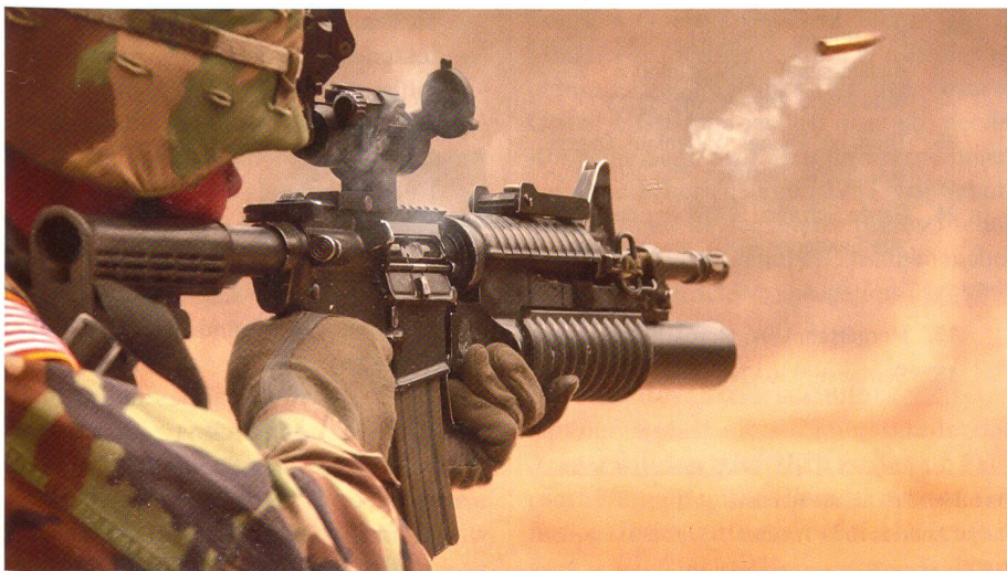
Das Colt M4 soll das M16 als Hauptbewaffnung der US-Bodentruppen ablösen.

Die US Army plant, die M4-Variante des altgedienten M16 als Hauptbewaffnung für ihre Bodentruppen einzuführen. Dabei soll eine neue kürzere und handlichere Version speziell für Einsätze auf und ab Fahrzeugen entwickelt werden. Trotzdem gibt es kritische Stimmen, welche dem System mangelnde Zuverlässigkeit in staubigen und sandigen Gegenden wie insbesondere Afghanistan oder Irak vorwerfen, und ein Modell mit einem geschlossenen Gassystem vorziehen würden. Weiter wurden bei verschiedenen Spezialeinheiten Modelle des SCAR eingeführt, da aufgrund der modula-