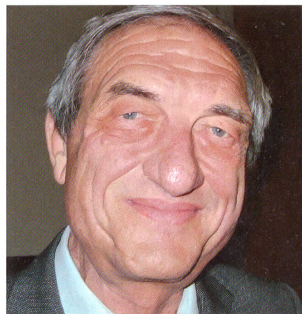
Fuhrer: «Die Schweiz hat ein Plus im Wappen, Österreich ein Minus.»