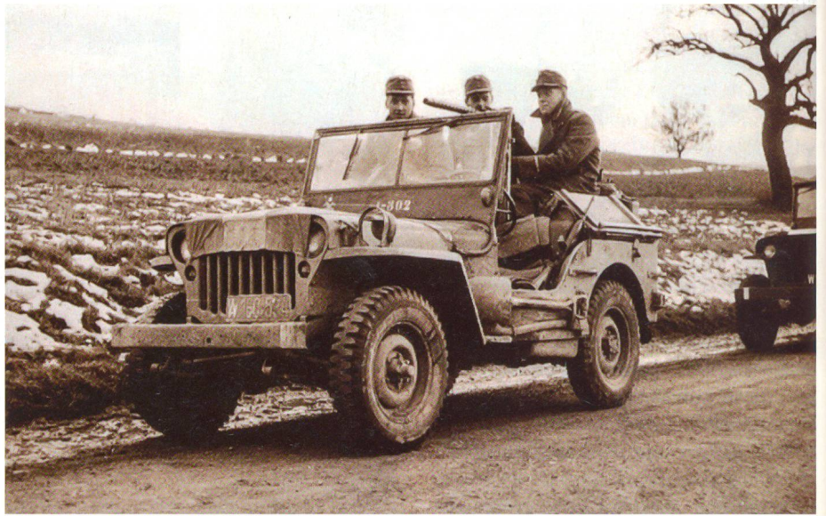
Ungarn-Krise im Oktober 1956: Grenzpatrouille im Jeep.

In Wien empfand das Volk den Vertrag als Katastrophe. Man redete vom «Staat, den keiner wollte». Staat und Staatsvolk fanden nicht zueinander. 1929 brach die