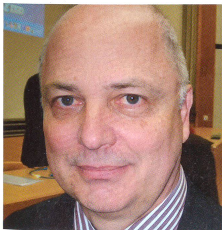
Rauchensteiner: «Der Anschluss von 1938 war Annexion, nicht Okkupation.»

In den 1990er-Jahren erwog Österreich den Beitritt zur NATO: «Aber das scheiterte am mangelnden politischen Konsens. Die Regierungsparteien SPÖ und ÖVP hatten dazu zu grosse Differenzen.» fö. +