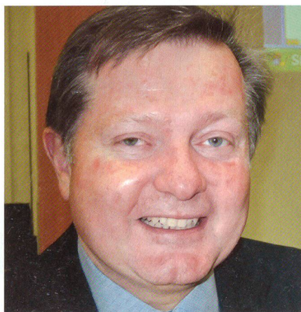
Schmidl: «Nicht immer hat die Politik das Bundesheer voll unterstützt.»