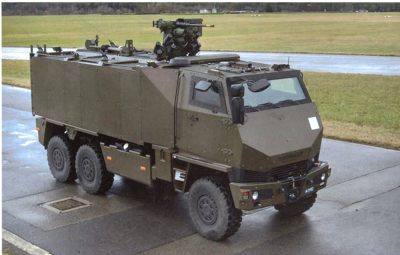
So präsentiert sich der DURO IIIP.

Ein Blick auf einige Konfliktherde dieser Welt zeigt, dass der einzelne Soldat heute permanent grossen Bedrohungen an Leib und Leben ausgesetzt ist, nicht nur im konventionellen Kriegsfall, sondern ausdrücklich auch in Raumsicherungs- und internationalen friedenserhaltenden Operationen. Alle modernen