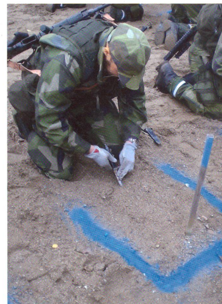
Detailarbeit muss sein.

Die erste Aufgabe am Dienstag war, einen Beobachtungsposten im Wald zu betreiben. Nach gründlicher Erkundung erfüllten wir diese Aufgabe während drei