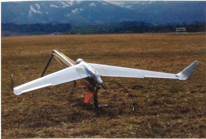
Israelische Minidrohone auf der Startrampe vor dem Abschuss.