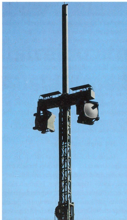
Die Übermittlung wurde per RAP Panzer mit Richtstrahlantenne sichergestellt.