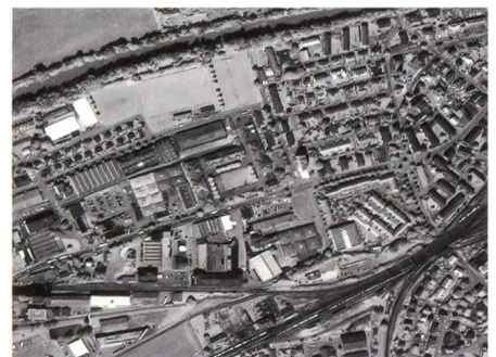
Bild vom Satellit EROS von der Umgebung des Zeughauses Burgdorf.