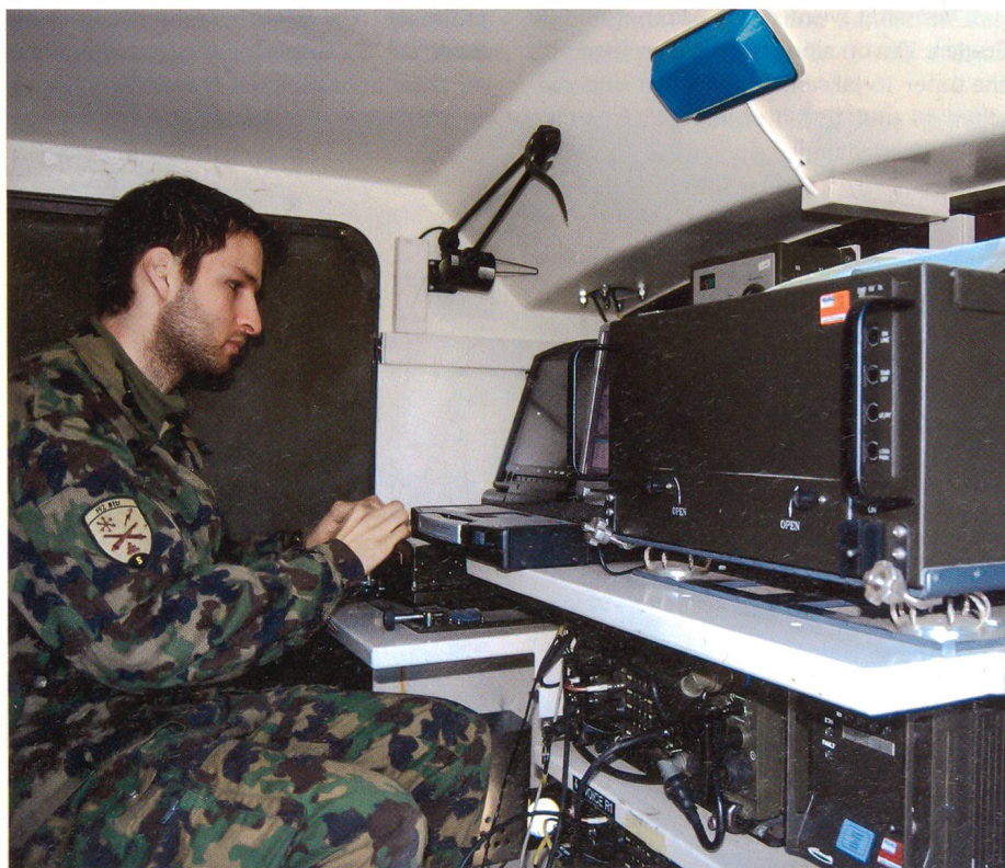
Ein Soldat wertet die Informationen vom Fesselballon aus.

Zur terrestrischen Aufklärung wurden Aufklärer der AGFA in den Raum geschickt sowie das Schiesskommandantenfahrzeug auf Basis des MOWAG Eagle eingesetzt. Dieser Wechsel vom Aufklärungsfahrzeug 93 respektive 93/97 zum Schiesskommandantenfahrzeug wurde vorgenommen, da als Mittel zur Verbreitung der Nachrichten innerhalb des Nachrichtenverbundes sowie zur Vernet-