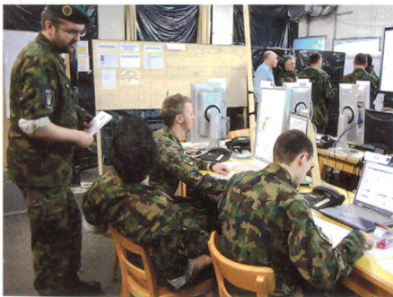
In die Nachrichtenzentrale werden sämtliche Daten per Richtstrahl übermittelt.