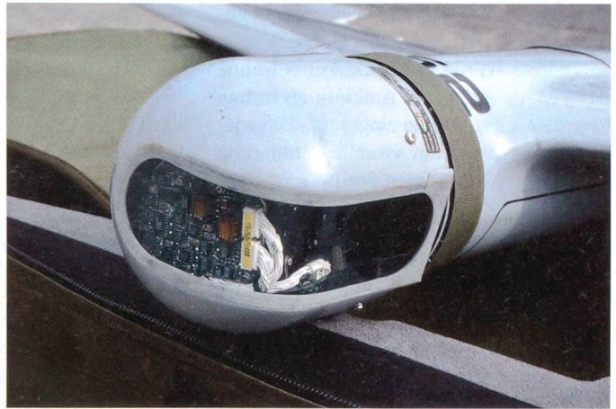
Modulare Sensoreinheit am Kopf der Minidrohone.