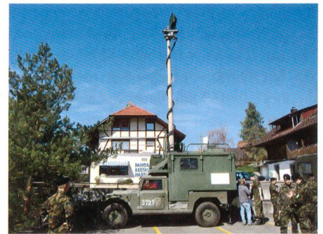
Antenne aufgebaut auf Geländefahrzeug Hummer in Steffisburg.