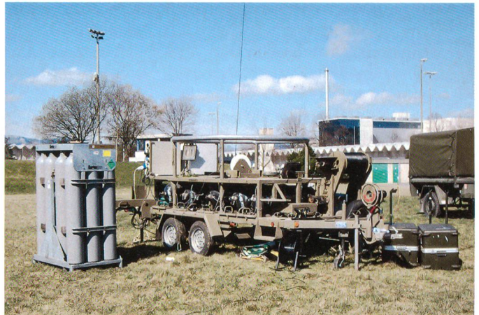
Bodenstation Fesselballon mit Winde und Gasflaschen.