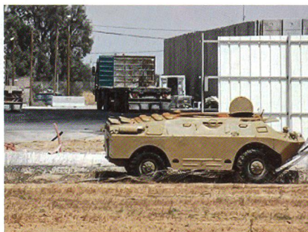
Ein Schützenpanzer BRDM der Hamas.

Gleichzeitig überzog die Hamas den Grenzstreifen und den nahen Kibbuz Ke-