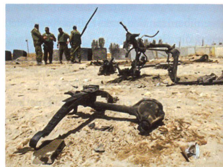
Was vom Sprengstoff-Jeep übrig blieb.