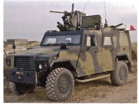
MOWAG Eagle IV mit fernbedienter Waffenstation.

Das polnische Verteidigungsministerium hat den Bedarf an 120 leichtgepanzerten Patrouillenfahrzeugen für seine internationalen Friedenstruppen, insbesondere für das Kontingent im Südosten Afghanistans angemeldet. Gefordert wird bei dieser Ausschreibung ein taktisches Fahrzeug mit einem Maximalgewicht von 7,5 Tonnen und der Möglichkeit bis zu 5 vollausgerüstete Soldaten aufzunehmen. Weiter soll der Schutz, insbesondere ge-