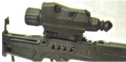
TAR-21 mit Lily-S.

Der israelische Rüstungshersteller Elbit hat unter der Bezeichnung Lily eine neue Familie von leichtgewichtigen Wärmebildzielgeräten für Infanteriewaffen vorgestellt. Dabei gibt es drei Versionen: Lily-S für Maschinenpistolen und Sturmgewehre, Lily-M für den Einsatz auf Maschinengewehren und Raketenwerfern sowie Lily-L für grosse Distanzen (bis 1,5 km) für Scharf-