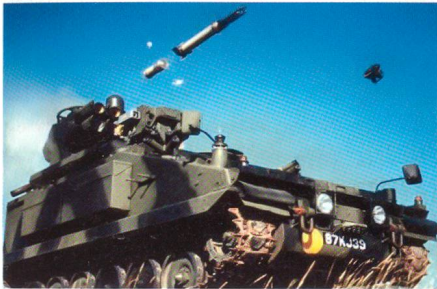
Testabschuss Starstreak II.

Der Rüstungshersteller Thales präsentierte kürzlich die Einsatzbereitschaft seines neuen Fliegerabwehrsystems Starstreak II. Neben einem Testschuss wurden insbesondere die neue Kontrolleinheit sowie das automatische Zielverfolgungssystem demonstriert. Die Zieldrohne wurde vom lasergelenkten Flugkörper, welcher über 3