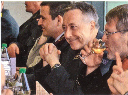
Gut gelaunter Ehrengast.

Die Veränderungen in Gesellschaft, Politik und Armee prägen auch die Lage des