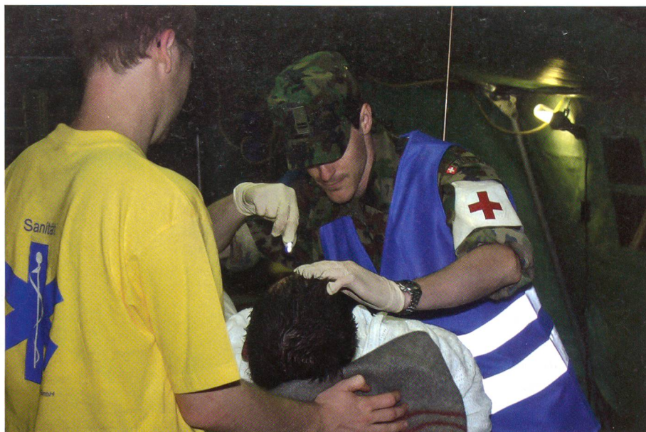
Ziviles und militärisches Sanitätspersonal kümmert sich professionell um einen Patienten.

Eine Module Sanitätshilfsstelle, eingerichtet in einer grossen Halle in der Nähe des St. Jakob-Stadions, ist bereit für den Ernstfall. Angehörige der Sanitätskompanie 42/4 arbeiten hier mit zivilem Sanitätspersonal Hand in Hand. Kurz vor Anpfiff des Spiels Holland–Russland wird der erste Notfall eingeliefert. Eine Ambulanz fährt vor, sofort kümmern sich die Helfer um die Person. Der Eingelieferte ist nicht ansprechbar. Der Militärarzt prüft sofort die Herz- und Atemtätigkeit, anschliessend den Blutdruck. Vermutlich wird dieser Patient ein Fall für eine Spitaleinweisung. Bis in die frühen Morgenstunden werden die auf dem ganzen Stadtgebiet verteilten Sani-