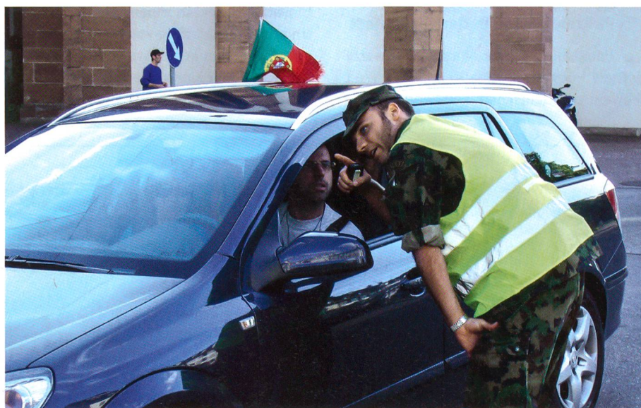
Ein Armeeinghöriger erklärt einem Automobilisten den Weg.