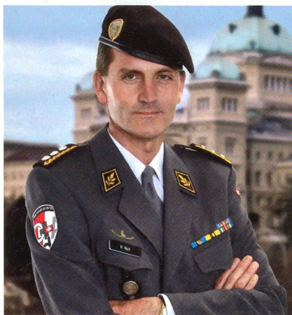
Roland Nef stellt sich am 13. September 2008 den Fragen aus dem Publikum.

Ein Sonderereignis kündigt der SCHWEIZER SOLDAT für die Comm'08 in Frauenfeld an: Am Samstag, 13. September 2008, findet in der Eventhalle auf dem Waffenplatz für die Leserinnen und Leser der Zeitschrift eine Begegnung mit KKdt Roland Nef, dem Chef der Armee, und mit Br Willy Siegenthaler, dem Kommandanten der FU Br 41, statt.