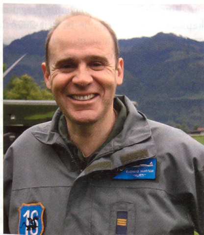
Hurter auf dem Feldflugplatz Tuggen.

Am 26. Mai 2008 genehmigte das Büro des Nationalrates die Schaffung einer Subkommission «Tiger-F-5-Ersatzbeschaffung». Zum Präsidenten wurde der Schaffhauser Nationalrat Thomas Hurter gewählt. Hurter ist von Beruf Pilot bei der SWISS. In der Miliz fliegt er den PC-6.