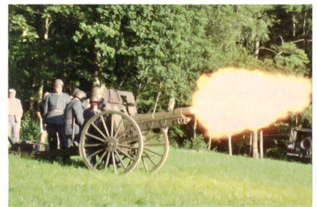
Böllerschüsse zu Ehren der Schweiz.

Um 10.30 Uhr startet der farbenprächtige Festumzug beim Werdmühleplatz, welcher durch die Bahnhofstrasse zur Stadthausanlage führt. Neben Trachtenvereinen, der Studentenschaft, Stadtmusik, Jodler und anderen nehmen ein militärischer Fah-