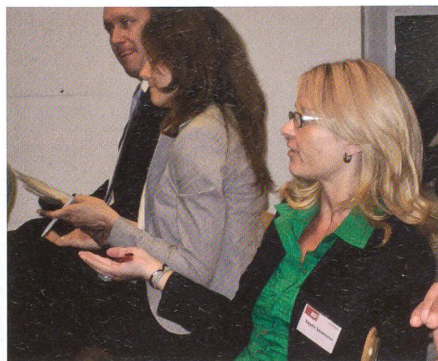
Reporter machen Mediendruck.

Ziel der Übung war es, mögliche Schwachstellen aufzuzeigen und Informationsschlücken zu schliessen. Diese und ver-