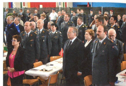
SUOV-Delegierte und Gäste.

Ebenso schnell wie die Wirtschaft, hat sich auch die Bedrohungslage geändert, führte er weiter aus. Direkte Angriffe auf Staaten geführt von anderen Staaten sind praktisch unvorstellbar geworden. Das Bedrohungsbild von heute muss Konflikten innerhalb von Staaten und dem globalisierten Terrorismus Rechnung tragen. Alle Armeen in Europa und um die Schweiz haben Reformen hinter sich, die aber alle eines gemeinsam haben: Die Sicherheit, die der Staat seinem Bürger garantieren soll, muss auch dem Kosten/Nutzen-Prinzip unterliegen. Konkret: mehr Professionalität innerhalb der Armee mit weniger monetärem