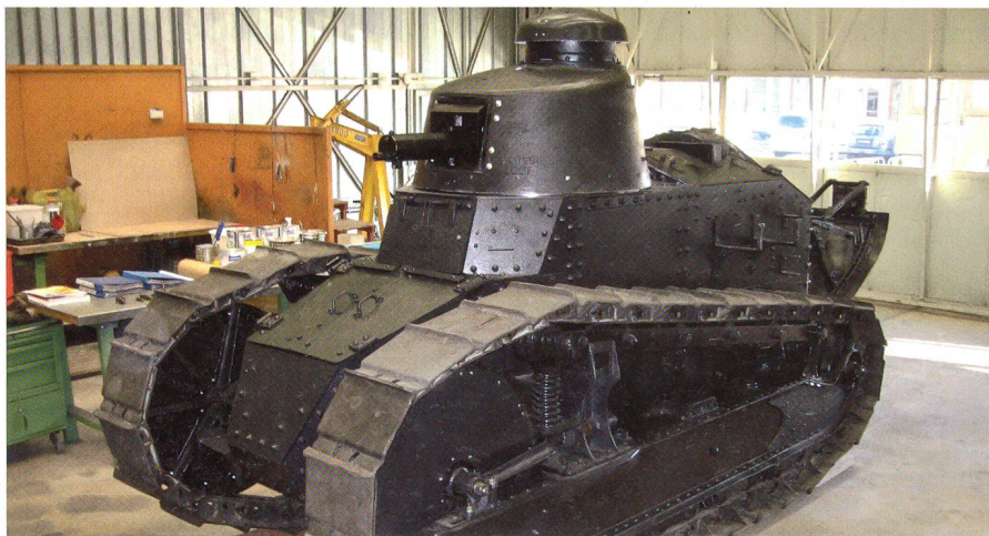
Der «Renault FT 17» in Thun – Jetzt wird auch der Motor fahrfähig gemacht.

Erfreuliche Kunde kommt von Divisionär Fred Heer, dem stellvertretenden Kommandanten der Teilstreitkraft Heer: Die Geldsammlung für den «Renault FT 17», den ersten Panzer der Schweizer Armee, zeitigte Erfolg.