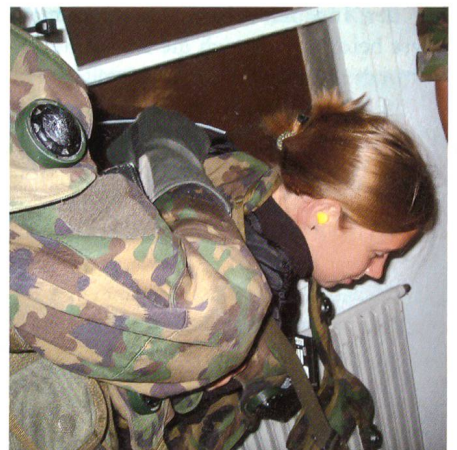
Aber sie wird gefasst und abgeführt, obwohl sie sich heftig zur Wehr setzt.