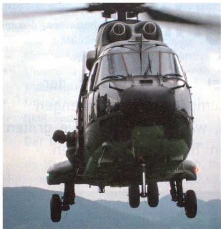
Der Super-Puma fliegt den Rosskopf von Osten her an und landet sicher.