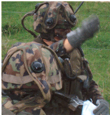
Befehlsausgabe nach der Landung auf dem Rosskopf: «Vorwärts, mir nach!».