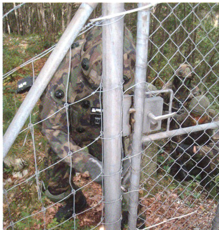
Ein Grenadier öffnet mit sicherer Hand und der stets bereiten Zange das Tor.