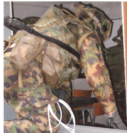
Hellchöpfli: Vom Wald her dringen die Grenadiere ins Zielobjekt ein.