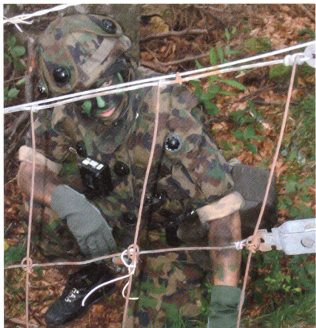
Hptm Schönenberger, Kdt Gren Kp 20/1, gibt Anweisungen am Hellchöpfli-Zaun.