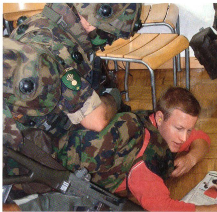
Grenadier überwältigt Terrorist.