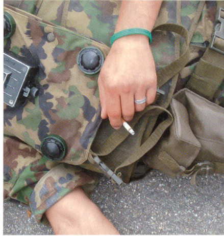
Gren Fabian Gamper, von Beruf Sanitärmonteur, raucht «die letzte Zigarette».

ein Grenadier trägt auf dem Rücken das Eindringmaterial: einen starken Hammer und eine riesige Zange.