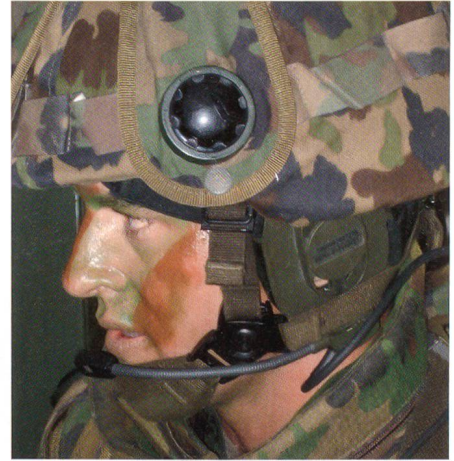
Jeder angreifende Grenadier trägt ein Mikrofon (Funksystem SE 151).

Der Unterstützungstrupp sichert die Fassade, der Eindringtrupp soll durch ein Fenster ins Gebäude stossen.