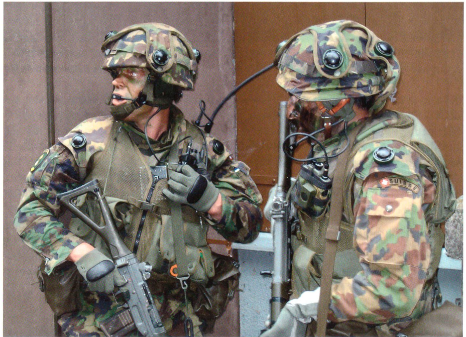
Auf dem Hellchöpfli: Letzte Absprachen vor dem Stoss ins Haus des Terrorführers.

Richten wir unser Augenmerk auf den Angriff der Grenadierkompanie 3/20. Im Morgengrauen hat es schon die Anfahrt auf