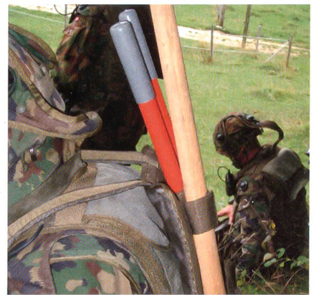
Immer dabei: Hammer und Zange.