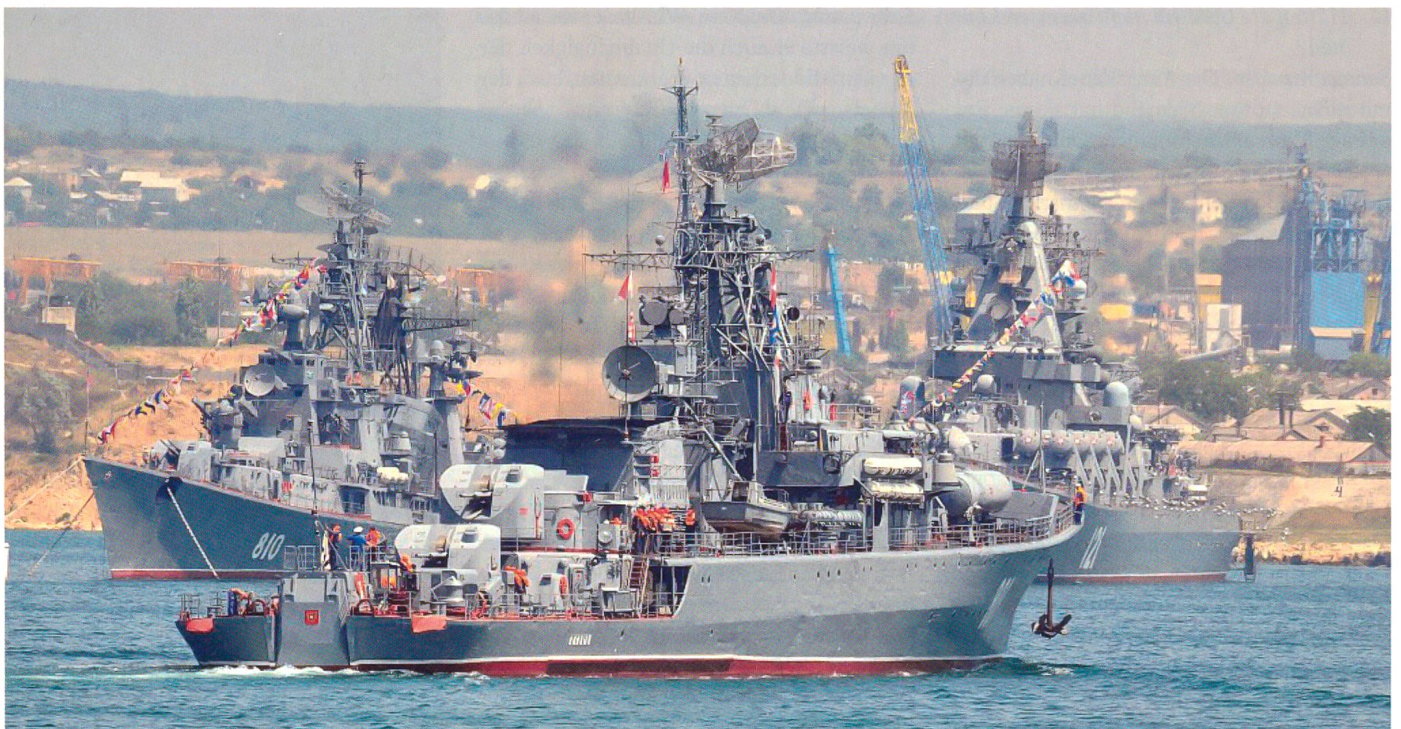
Zwei der drei an der Aktion gegen Georgien beteiligten russischen Kriegsschiffe sind hier im Hafen von Sevastopol vor Anker erkennbar, nämlich hinten links der Raketenzerstörer 810 «Smetlivyi» der «Kashin»-Klasse und hinten rechts der Raketenkreuzer 121 «Moskva» der «Slava»-Klasse. Vorne ist ferner die Raketenfregatte 801 «Ladnyi» der «Krivak II»-Klasse sichtbar.

Wenn schon, sagen einige, liegt der Fehler beim Westen selber. Natürlich, diese Wortwahl kommt uns bekannt vor. Wenn