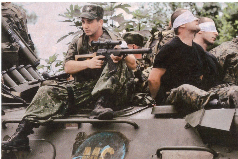
Russische Besatzer, georgische Kriegsgefangene: Demütigung für den Verlierer, der sich provozieren liess.

«Dioskuria», ein von Griechenland geliefertes Raketenschnellboot der «Combattante II»-Klasse, beschädigt.