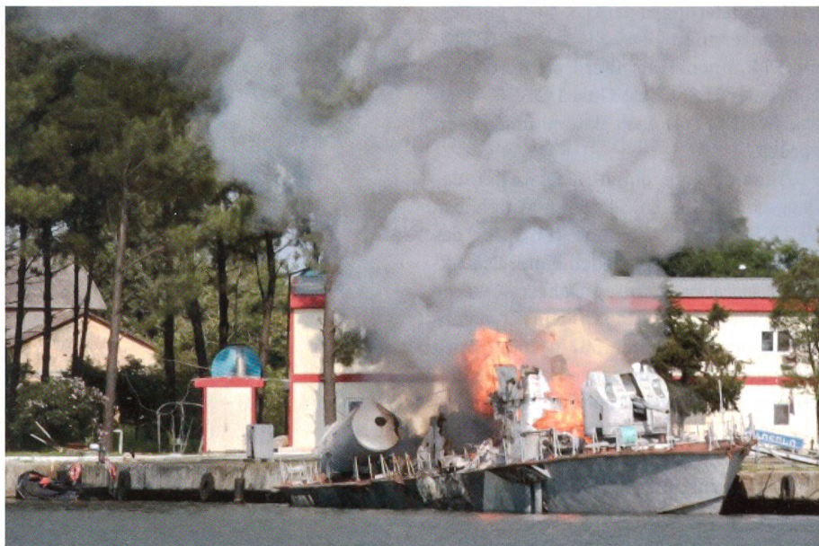
Das Raketenschnellboot «Tbilisi» der «Matka»-Klasse der georgischen Marine – seinerzeit von der Ukraine geliefert – zerstört und versenkt im Hafen von Poti.

Das seinerzeit von der Ukraine gelieferte Raketenschnellboot «Tbilisi» der «Matka»-Klasse wurde durch eine SS-N-9 «Malakhit» (NATO Bezeichnung «Siren») der «Mirazh» versenkt und die anderen Boote, darunter die