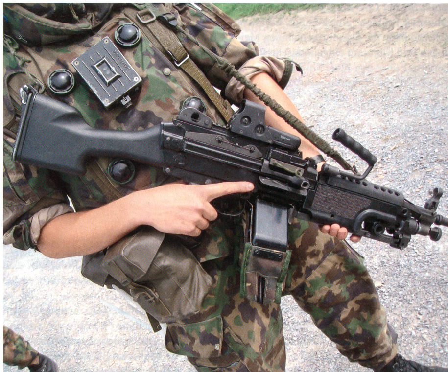
Bild vom 18. September 2008, kurz vor der Nationalratsdebatte, auf dem Breitfeld St. Gallen: Das neue Leichte Maschinengewehr 05 – wer redet da von «Schrott»?