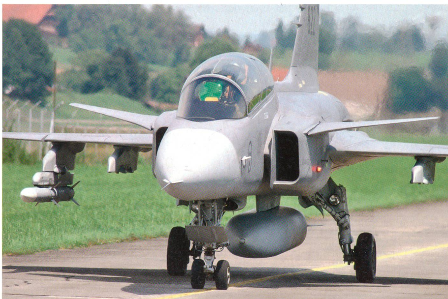
Der Gripen auf der Rollbahn in Emmen.