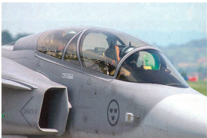
Zwei Flieger im Gripen-Cockpit.