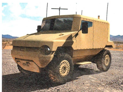
Der SPV 400 der Firma Supacat.

Die britische Firma Supacat hat ein leicht geschütztes 4x4-Patrouillenfahrzeug der neuesten Generation vorgestellt. Das SPV 400 besitzt ein voll integriertes Schutzsystem mit V-förmiger Stahlhülle gegen Minen, Minenschutzsitzen, einer ballistisch geschützten Insassenhülle und separaten Achsaufhängungen, die bei einer Minendetonation wegbrechen, ohne die Hüllenstruktur zu beeinträchtigen. Durch Verwendung der CAMAC-Kompositpanzerung der Firma NP Aerospace wird ein optimiertes Schutz-Gewichtverhältnis erreicht, was eine hohe Beweglichkeit im Gelände und im überbauten Gebiet ermöglicht. Das 7,5 t wiegende Fahrzeug hat eine Nutzlast von 1,5 t und kann sechs Personen transportieren.