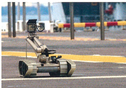
iRobot PackBot EOD.

Die hoch geschützten EAGLE-Ambulanzfahrzeuge werden bestehende Fahrzeuge der Bundeswehr ersetzen, um die Sicherheit der deutschen Soldaten in aktuellen Auslandseinsätzen zu erhöhen. Das Fahrzeug wird mit einem Fahrer und zwei Sanitätssoldaten besetzt und ermöglicht den Patiententransport und die medizinische Erstversorgung unter hohem Schutz gegen ballistische Bedrohungen, Minen und improvisierte Sprengmittel. Dank seiner hohen Verlegfähigkeit, seiner Wendigkeit und taktischen Beweglichkeit eignet