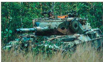
Leopard 1 der australischen Streitkräfte.

Brasilien hat den Ankauf der Kampfpanzer im Rahmen eines Regierungsgeschäftes mit der Bundesrepublik Deutschland vereinbart. Darüber hinaus sieht der Lieferumfang an den südamerikanischen Kunden auch Ausbildungsgeräte, Simulatoren, Fahrschulpanzer und technische Unterstützung vor Ort vor. Der LEOPARD 1