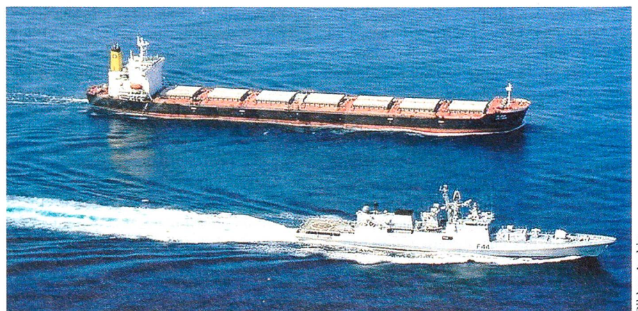
Indische Fregatte «Tabar» und ein Frachtschiff.

Ende November 2008 ist vor Somalia ein Angriff auf das US-Kreuzfahrtschiff «Nautica» misslungen, Anfang Dezember vereitelte die deutsche Fregatte «Mecklenburg-Vorpommern» – Flaggschiff der «Coalition Task Force 150» – einen Angriff auf das deutsche Kreuzfahrtschiff «Astor».