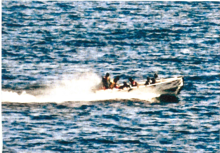
Ein Angriffsboot der Piraten.

Schliesslich werden bereits Möglichkeiten im Bereiche nicht-tödlicher Waffen in Betracht gezogen. Hier werden etwa