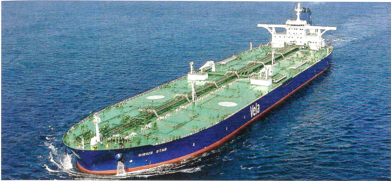
Der Supertanker «Sirius Star», der im November vor der Küste Somalias von Piraten gekapert wurde.

Wenig zimperlich, aber rechtlich nicht ganz unbedenklich, war der kürzliche Akt von «Selbstjustiz», als die indische Fregatte «INS Tabar» am 19. November 2008 gegen Piraten vorging und das vermeintlich somalische Schiff versenkte, das sich später aber als Trawler Thailands herausstellte.