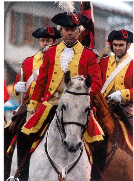
Die Berner Dragoner beim Vorbeimarsch.