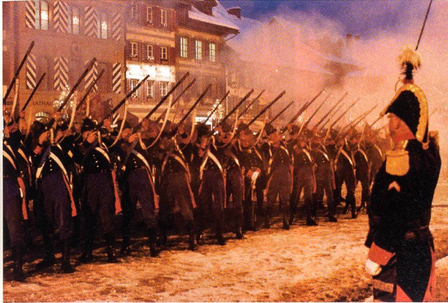
Grenadiere von Fribourg beim Salut für Samuel Schmid.