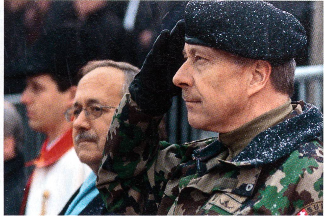
Samuel Schmid und André Blattmann bei der Landeshymne.