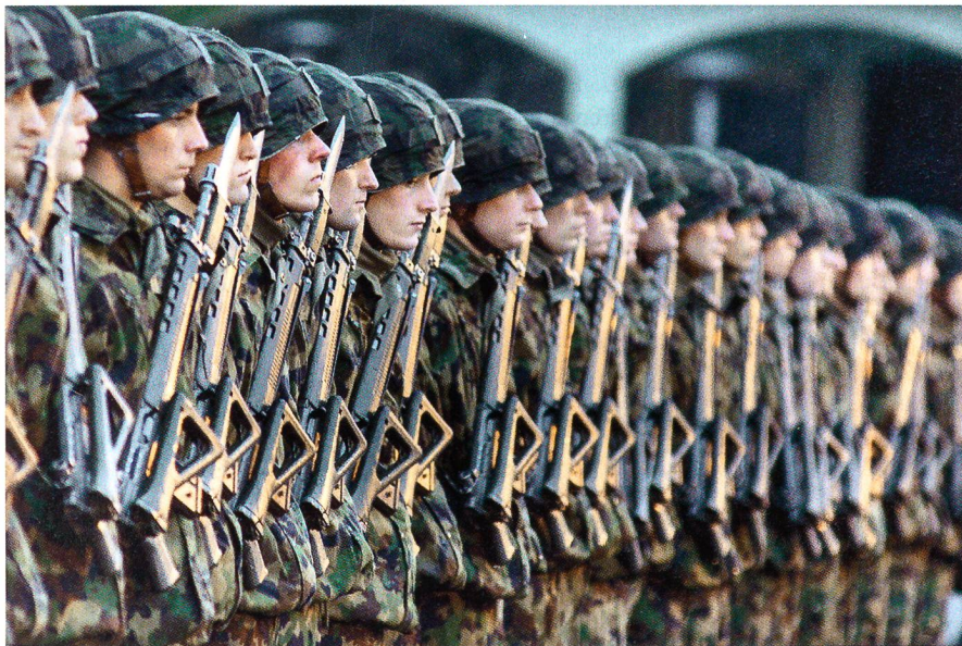
Die Kompanie zu Ehren von Bundesrat Schmid.