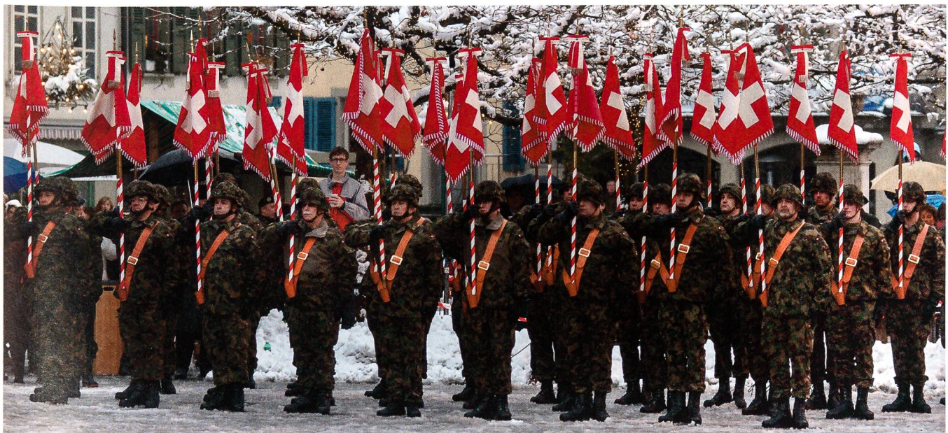
Die Fähnriche mit den Feldzeichen in Reih und Glied.