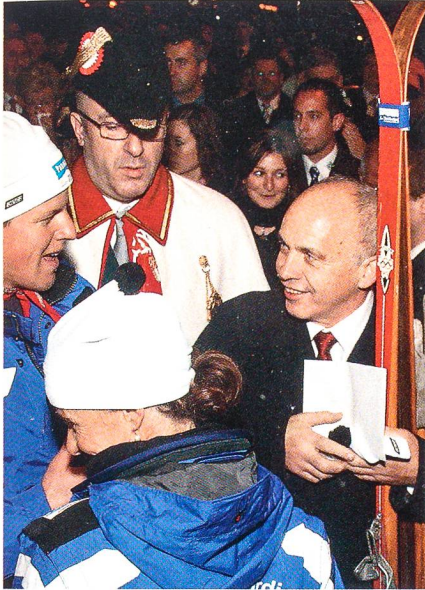
Ein Paar Skis für den Sportminister.