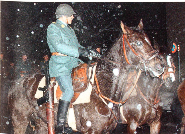
Die Kavallerieschwadron 1972 führt den Festumzug an.