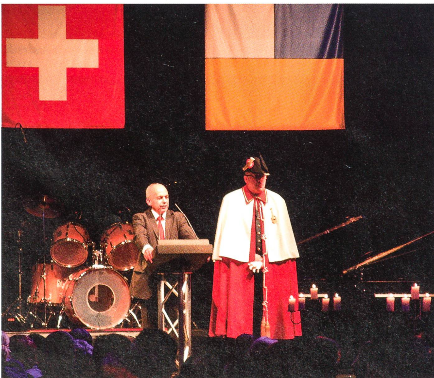
Bundesrat Ueli Maurer mit seinem Weibel.