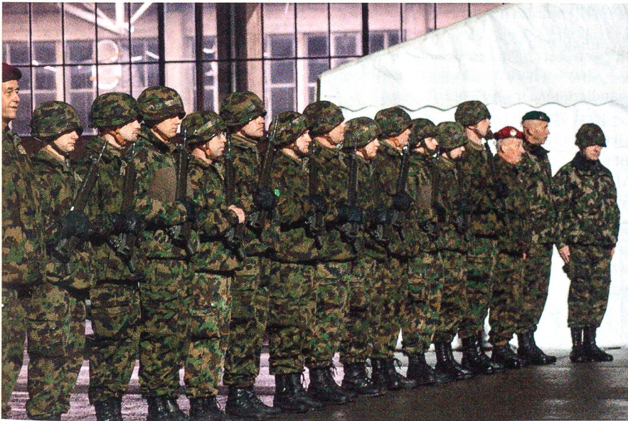
Die Ehrenformation der Unteroffiziere.