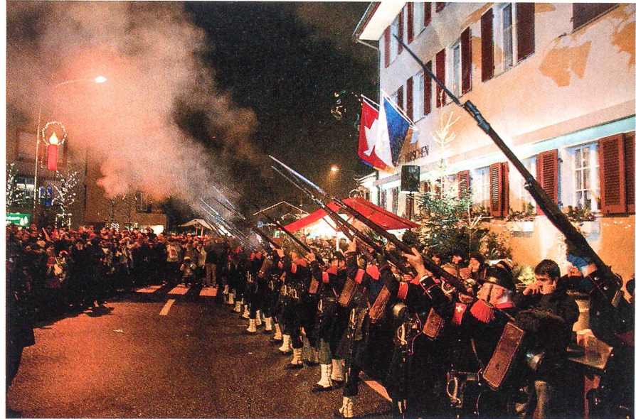
«Feuer frei!» zu Ehren von Bundesrat Maurer.