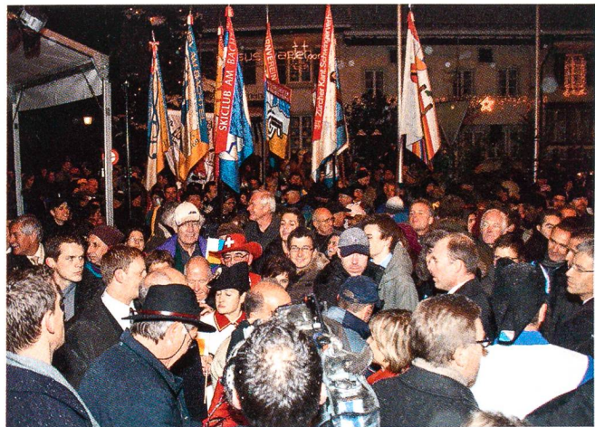
Dichtes Gedränge vor der Bühne.