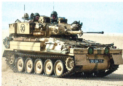
Scimitar der «Queen's Dragoon Guards».

Mechanisierte «Aufklärungs»-Verbände, welche in Afghanistan stationiert sind, sind überzeugt, dass die aktuell eingesetzten Raupenfahrzeuge des Typs Scimitar nur beschränkt durch Radfahrzeuge des Typs Jackal ersetzt werden können. Insbesondere