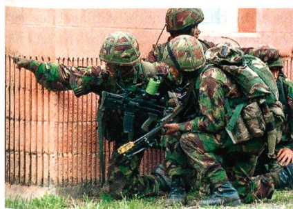
Kämpfer der berühmten Gurkhas.

Die britische Army hat entschieden, die Unterbestände bei den britischen Infanteriebataillonen durch «Gurkhas» aufzufüllen. Aufgrund der hohen Truppenbelastung durch die Einsätze in Afghanistan und im Irak werden nepalesische Soldaten zusam-