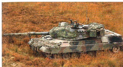
Kampfpanzer Leopard 1.

Die ecuadorianische Regierung hat die Unterzeichnung eines Vertrages über den Kauf von 30 vormalig chilenischen Kampfpanzern des Typs Leopard 1 bekanntgegeben. Der Kauf ist Teil eines Programms zur Erneuerung der Panzerstreitkräfte, welche