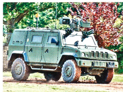
IVECO LMV mit fernbedienter Waffenstation.

Die österreichische Armee hat in Italien bei IVECO-Defence Vehicle Division 150 Fahrzeuge des Typs LMV (Light Multirole Vehicle) bestellt, um den Bedarf nach leichten und minengeschützten Fahrzeugen zu decken. Der Gesamtwert dieses Auftrags beträgt 104 Mio. €. Der LMV soll Truppen unter Schutz transportieren sowie für Auf-