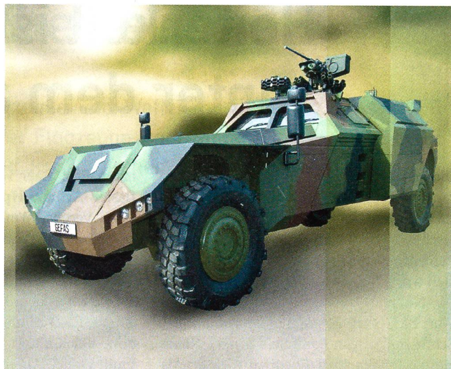
Das Geschützte Fahrzeugsystem GeFaS ist ein zukunftsweisendes Fahrzeugsystem, bei dem bereits in der Entwicklung ein besonderes Augenmerk auf Modularität der Bauweise gelegt wurde.