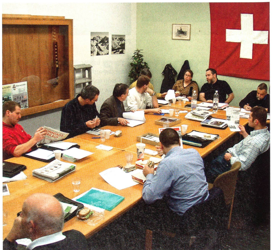
Die SUOV-Sektions- und Kantonalvorstände setzen sich intensiv und mit viel Engagement für die Armee ein.