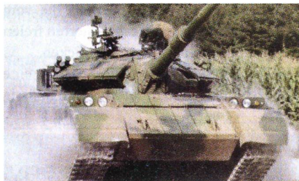
Poly Technologies Type 59P.

Der chinesische Rüstungshersteller Poly Technologies hat einen kampfwertgesteigerten Kampfpanzer «Type 59» vorgestellt, welcher in den Bereichen Schutz, Feuerkraft und Beweglichkeit erheblich verbessert wurde. Das neue Modell mit der Bezeichnung «Type 59P» wurde zum Schutz gegen Lenkwaffen und Geschosse mit Hohlladungen respektive Tandemhohlladungen mit einer Reaktivpanzerung der zweiten Generation ausgestattet, welche am Turm und im Frontbereich angebracht ist. Weiter wurde ein Motor mit neu 730 statt nur 530 PS eingebaut. Zur verbesserten Zielerfassung und -bekämpfung wurde ein neues