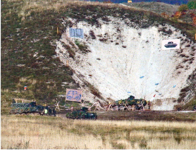
Auf dem Schiessplatz Bière.