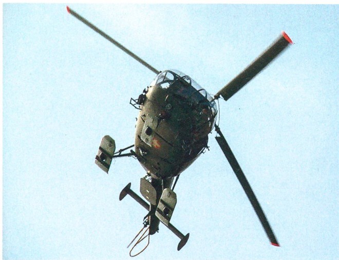
Auf dem Schiessplatz Vugelles.