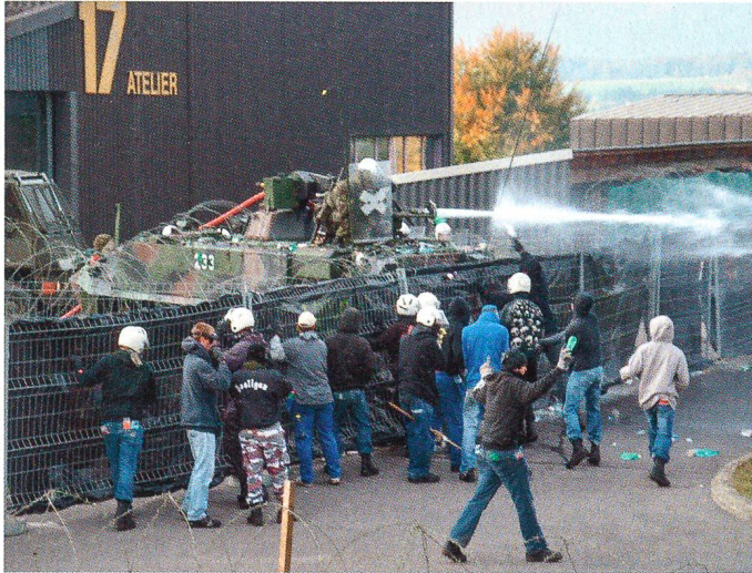
Auf dem Waffenplatz Chamblon Nord.