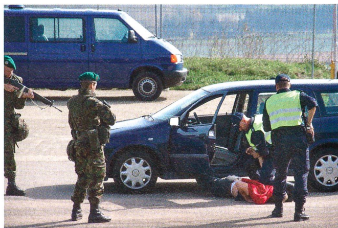
Der Terrorist wird überwältigt.