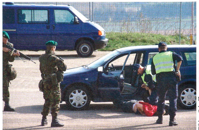
Der Terrorist wird überwältigt.