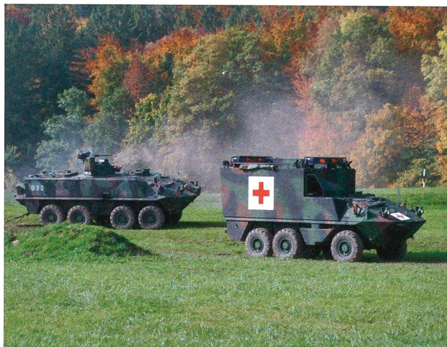
Radschützenpanzer und Sanität.

wacht-Detachement. U Ablauf: Betrieb Checkpoint mit Personenkontrolle und Fahrzeugüberprüfung, Zusammenarbeit mit Grenzschutz-Detachement für spezifische Kontrollen, Verhindern eines gewaltsamen Durchbruchs von Terroristen-Fahrzeugen.