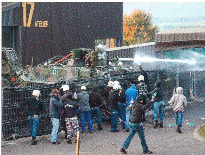
Auf dem Waffenplatz Chamblon Nord.