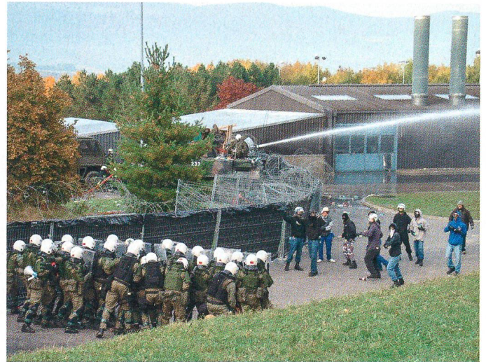
Einsatz gegen Randalierer.

Besatzung mit dem schweren Bord-Mg 12,7 mm. Den Höhepunkt des Tages bildete die Durchführung einer Angriffsaktion einer verstärkten Infanterie-Kompanie.