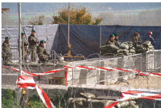
Auf dem Waffenplatz Chamblon Süd.

Standort: Waffenplatz Chamblon Süd. U Anlage: Grosser Grenzübergang für Fahrzeuge und Fussgänger. Mittel: Infanterie Zug mit Spz 93 (Piranha), Militärpolizei-Detachment mit Hundeführer, Grenz-