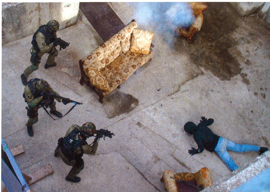
In der Ortskampfanlage Le Day.

Den Abschlusstag des European Infantry Seminary gestaltete die Infanterieschule Bière. Hier wurden die Teilnehmenden mit der Ausbildung der Schützenpanzer-Besatzungen (Piranha 2) bekannt gemacht. Vorgeführt wurden die Simulator-Anlagen für die Spz-Fahrer und für das Schiessen der