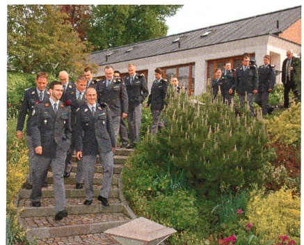
Die «Silbergrauen» im Anmarsch (VBA Telematik 61, Frauenfeld).

muss erhalten bleiben. Man muss sich einmal bewusst sein, was mit einer Annahme der Initiative verbunden ist.