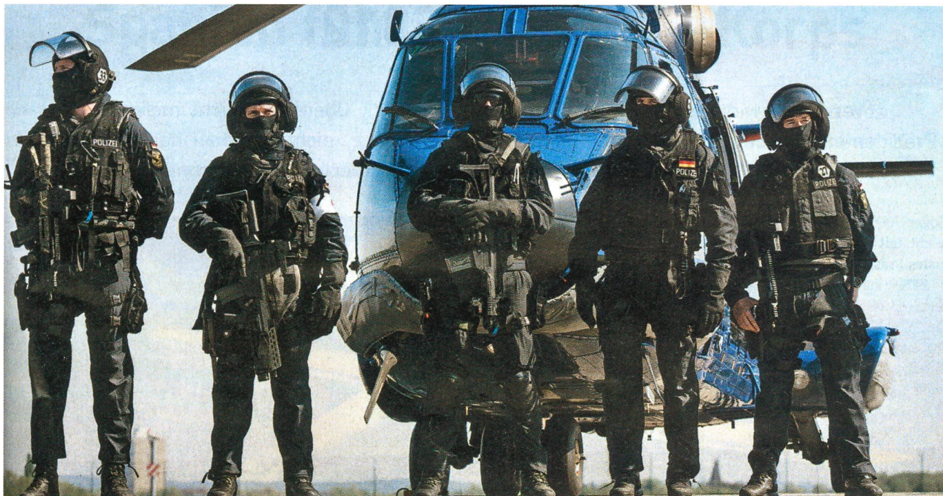
Kämpfer der GSG 9, wie immer vermommt, mit einem Einsatzhelikopter.