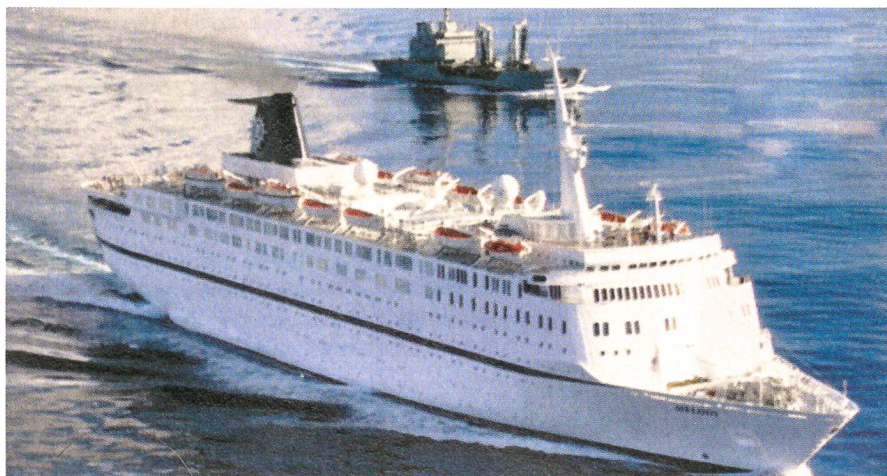
Ein spanisches Schiff geleitet den Kreuzfahrer «Melody» ins sichere Gewässer.

Wer hat das italienische Kreuzfahrtschiff «Melody» gerettet? Neun Seeräuber hatten gut 700 Seemeilen von Somalia entfernt versucht, die «Melody» mit ihren 1000 Passagieren zu entern.