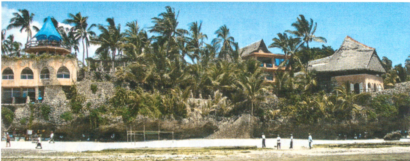
Das vorgeschobene GSG-9-Hauptquartier am Strand von Mombasa.

Schiffe mit insgesamt 800 Mann Besatzung zum amerikanischen Helikopterträger: die Fregatten «Rheinland-Pfalz», «Mecklenburg-Vorpommern» und «Emden», dazu das Versorgungsschiff «Berlin».