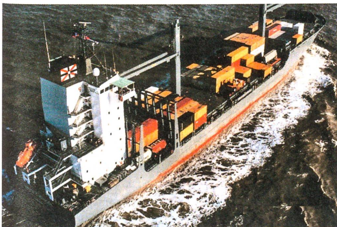
Der deutsche Frachter «Hansa Stavanger».