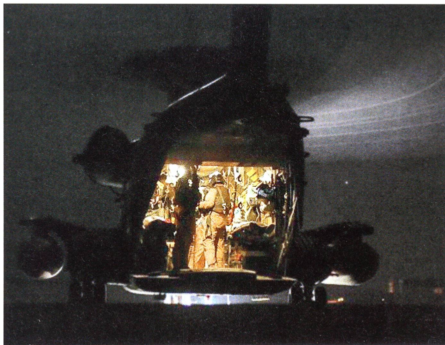
29. April 2009 bei Kunduz: Die Bundeswehr evakuiert Verletzte in einem Helikopter.

Zudem setzten sie zwei Suizid-Attentäter ein; die Selbstmörder sollten in Fahrzeugen in den Bundeswehr-Konvoi hineinrasen und Sprengladungen auslösen. Sie wurden jedoch von wachsamen Bundes-