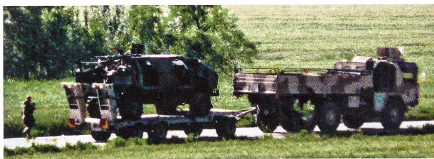
30. April 2009, 17 Kilometer vom Lager weg: Ein getroffener Dingo wird weggeführt.

wehrsoldaten auf Entfernung ausgemacht und auf Distanz in die Luft gejagt, sodass sie keinen Schaden anrichten konnten.