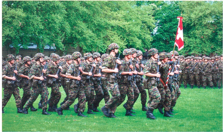
Das schwungvolle Hauptquartierbataillon 25 bei der Standartenübernahme.

Er begrüusste seine Soldaten: «Viele neue Kameradinnen und Kameraden aus anderen Waffengattungen wurden uns zugeteilt. Für einige der neu Eingeteilten ist ein Hauptquartier Neuland – es gibt viel