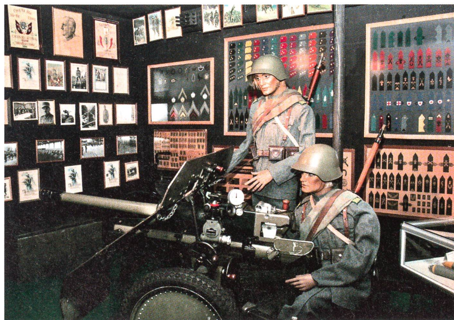
Das Ausstellungsgut wird anschaulich dargeboten.