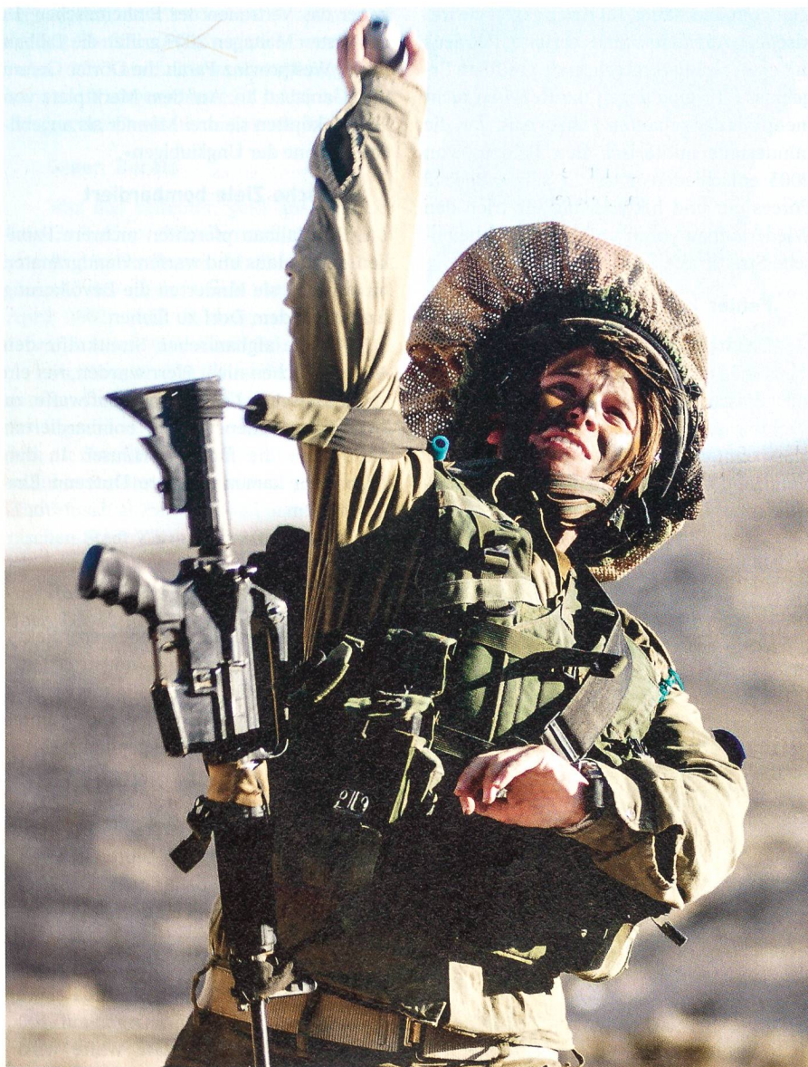
Handgranatenwurf mit vollem Einsatz.

Das Gerichtsurteil und die weitergehenden Anstrengungen von Frauenrechtlerinnen, Frauen für Kampfeinsätze in Bodentruppen wie auch in der Luftwaffe zuzulassen, zwang das Militär, die Frage der Rolle der Frauen innerhalb der IDF zu überdenken.