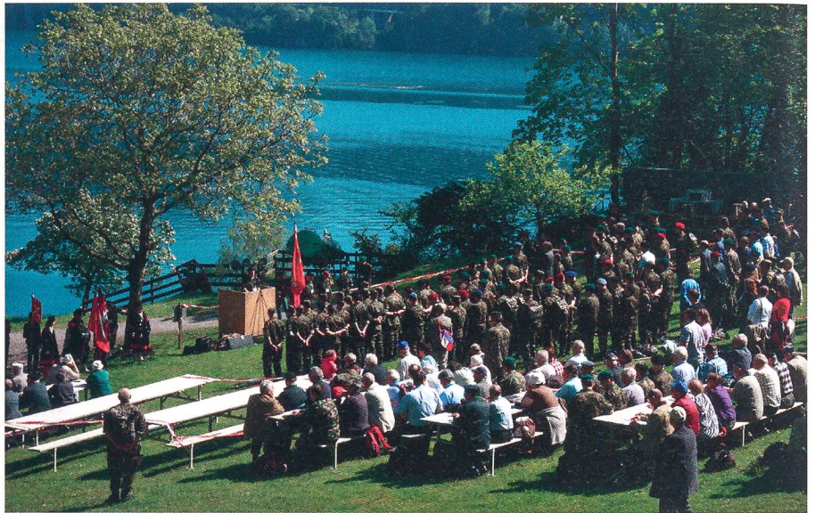
SUOV-Delegierte und Gäste auf dem Rütli.

Regierungsrat Josef Dittli rief die Anwesenden auf, sich für eine starke Nation einzusetzen. Mit Blick auf den Veränderungsprozess der Armee wies er in seiner Grussbotschaft an die SUOV-Delegierten darauf hin, dass loslassen von Altem unumgänglich sei. Aufbruch sei auf dem Rütli angesagt. «Trauert nicht dem Alten nach, die Zukunft bringt neue Chancen!» schloss er seine Botschaft.