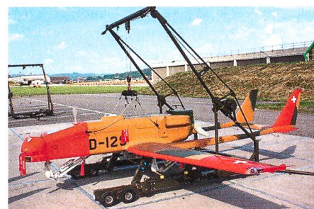
Die Drohne ADS 95.

Artillerieabteilung 32: Feuerleitung via Drohnen