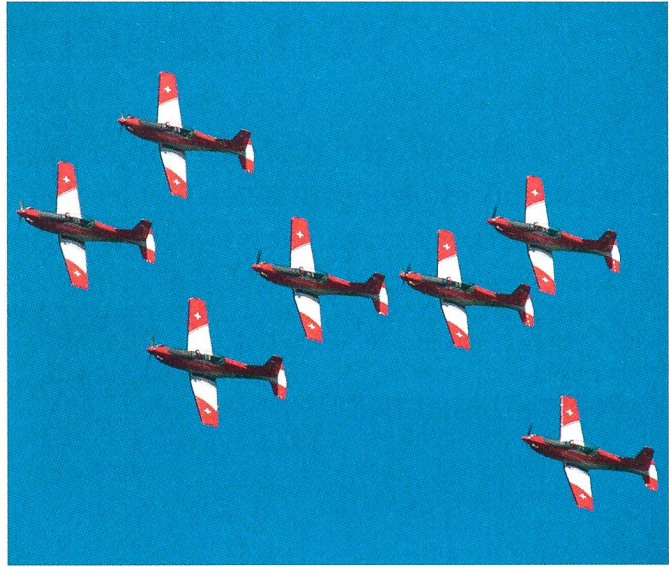
...und das PC-7-Team.