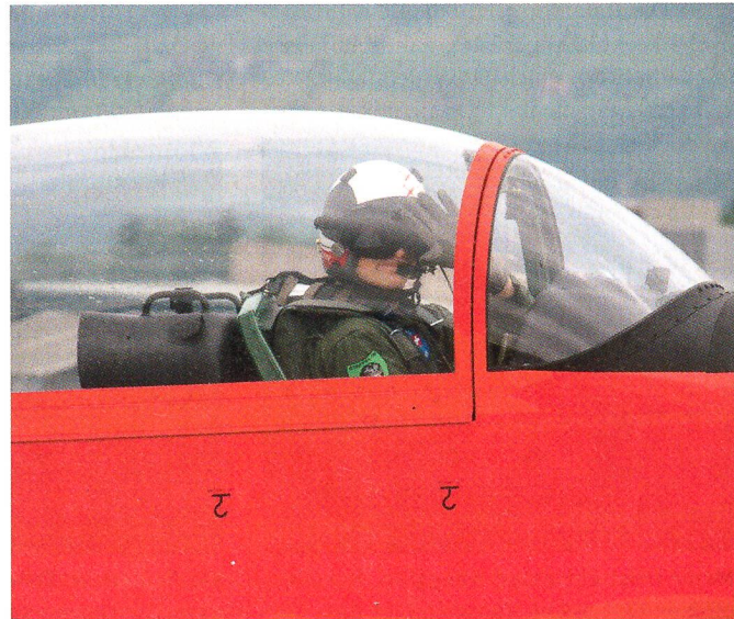
...und das PC-7-Team.