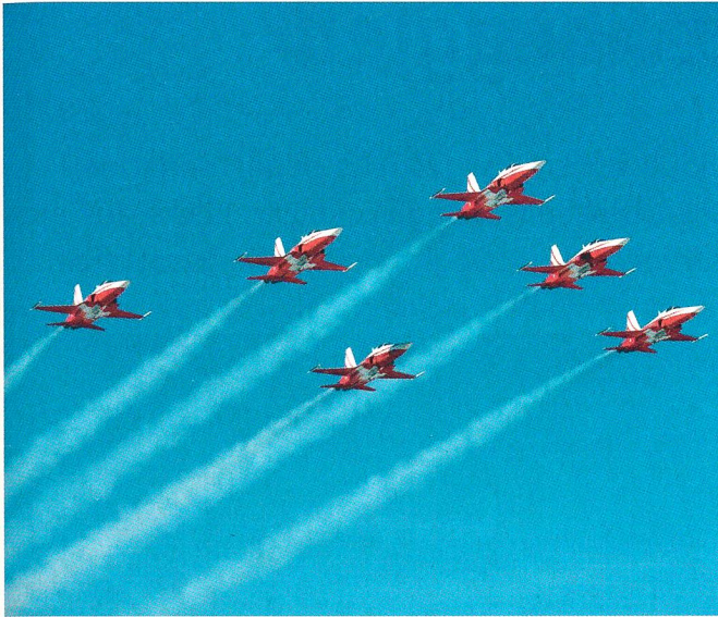
In vollem Einsatz: Die Patrouille...