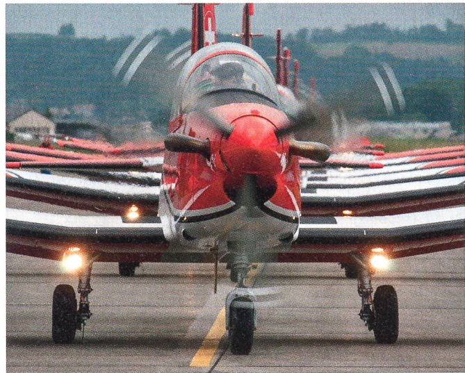
...und der PC-7.