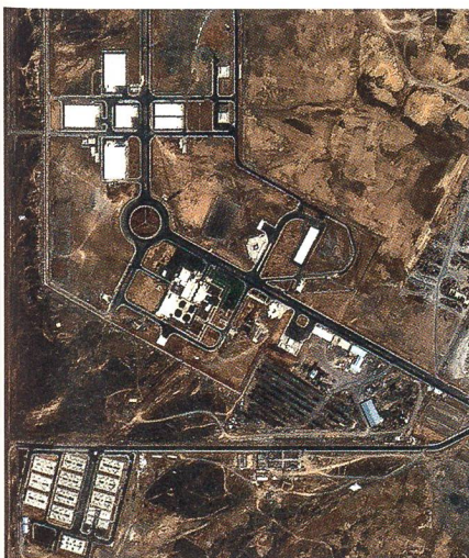
In Natans wird Uran so angereichert, dass es für die Bombe geeignet ist.