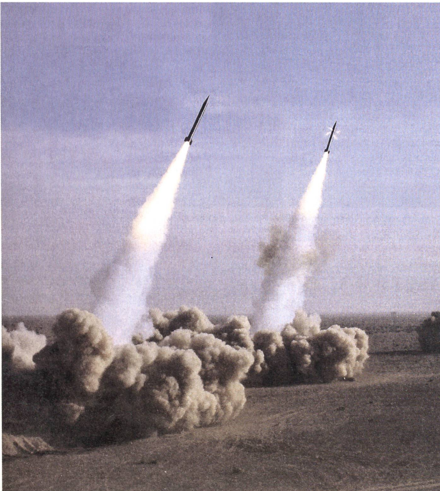
Raketentest in der Wüste bei Qom. Die Raketen reichen 2000 Kilometer weit.

Ausländische Geheimdienste wissen viel über die Zentrifugen-Kaskaden in der Atomanlage Natans und die geheimen Beschaffungen der Perser. Sie errechnen, in welchem Zeitraum Teheran wie viel waffen-