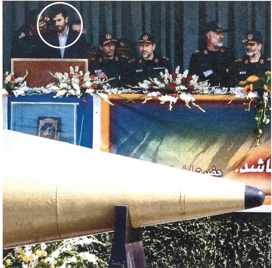
Präsident Ahmadinedjad nimmt eine Parade ab. Vor ihm eine Shahab-3-Rakete.

Der Bayer fliegt am anderen Tag mit dem Flug TK 1579 nach Düsseldorf. Dort schlagen die Beamten des Zollkriminalamtes zu: Sie verhaften den Bayern auf der Stelle. Und schon glauben die deutschen Ermittler, den nächsten Fisch an der Angel zu haben: Ali Alaei, iranisch-kanadischer Doppelbürger, Chef der Import-Export-