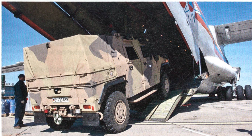
Die deutsche Bundeswehr beschafft von der Kreuzlinger Firma MOWAG 198 Eagle.

Planmässig wurden die ersten Eagle IV der deutschen Bundeswehr am Flughafen Rostock-Lange für den Lufttransport nach Afghanistan verladen.