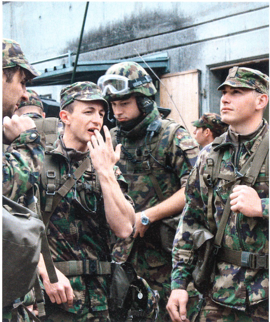
Unverändert bleibt die Armee die Schule der Nation: Kämpfer des Inf Bat 65.

So sollten im starken Gelände durch infanteristische Verbände in Stützpunkten und Sperren lang andauernden Widerstand geleistet werden. Gleichzeitig wollte man