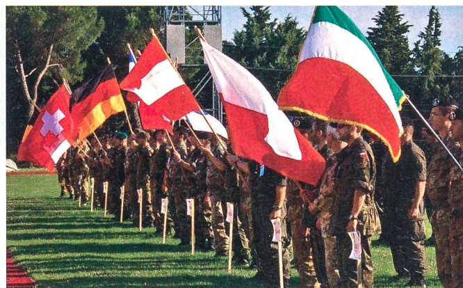
Impressionen des AESOR-Wettkampfs vom 26. und 27. Juli 2009 aus dem italienischen Viterbo.