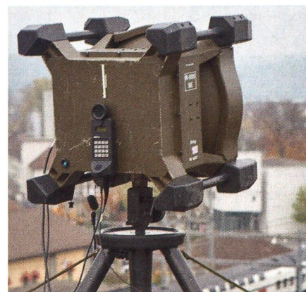
Richtstrahlbataillon 16: Hoch hinauf zu den Knoten