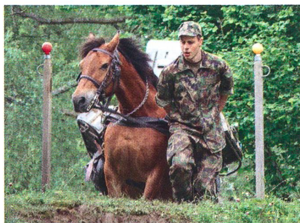
Pferd und Wehrmann.

Bei unerwartet schönem Wetter haben die diesjährigen Pferdesport- und Traintage der Armee stattgefunden. Nebst den herkömmlichen Prüfungen wie Dressur, Springen