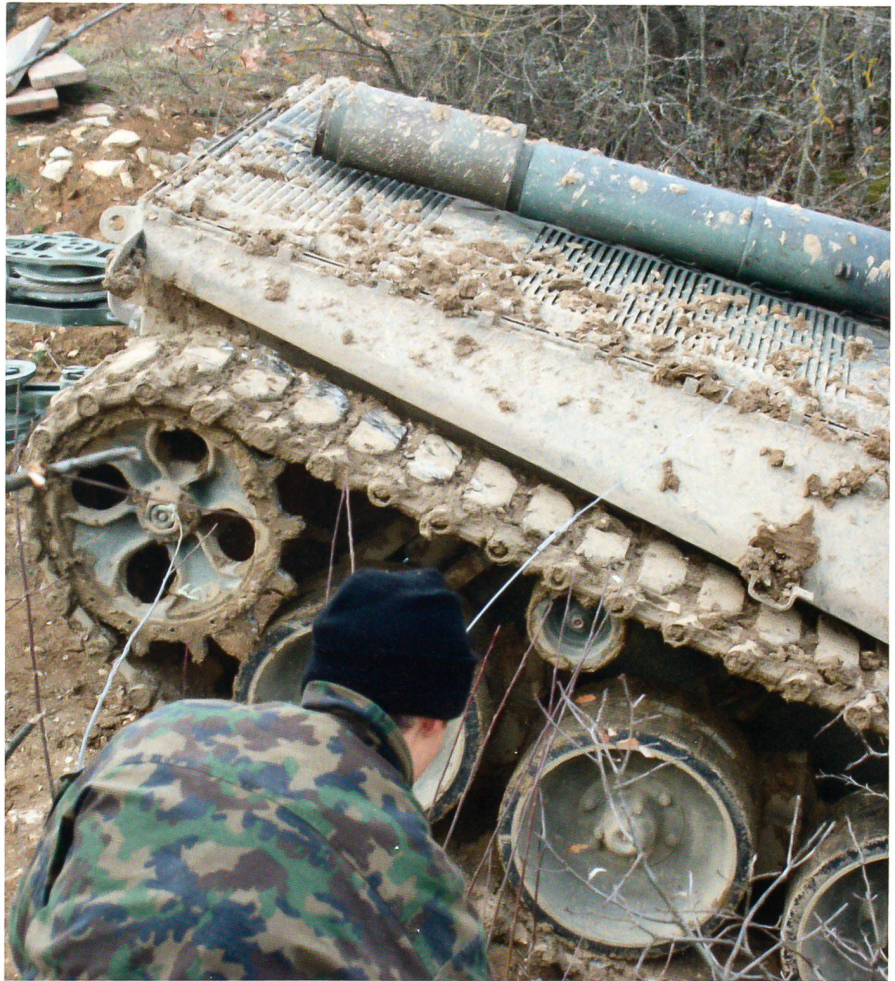
Immer ist der Einsatz in der Armee mit Gefahren verbunden.

Dazu hat die MV das von der Suva in der Unfallversicherung entwickelte Schadenmanagement übernommen und auf die