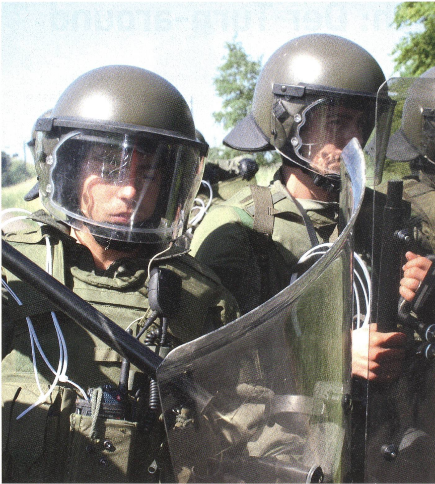
Was zählt, ist der innere Zusammenhalt, die gute Kameradschaft.

konfessionellen und parteipolitischen Neutralität.