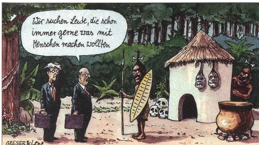
Europa wirbt in aller Welt um Fachkräfte.

Ursula Bonetti: Tag der Unteroffiziere in Sion