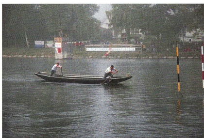
Jungpontoniere auf der Aare.

Nachdem zwei Parcours durch die Zuständigen im OK erarbeitet worden waren, wurden diese vom Verband abgenommen und genehmigt. Danach galt es die diversen Wettkampfbauten zu erstellen und die be-