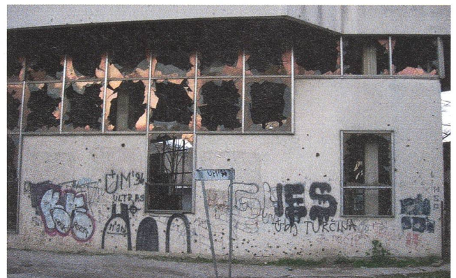
So sieht es in Bosnien teilweise immer noch aus.