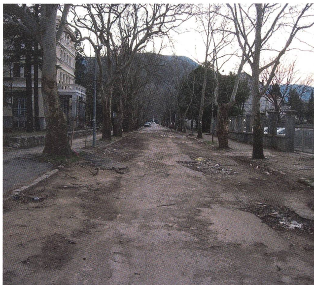
Wohin führt der Weg?