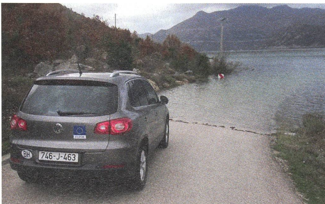
Das kann schon einmal vorkommen auf dem Balkan!

Nach dem Mittagessen wird eine motorisierte Patrouille oder Fusspatrouille in der Umgebung des vorausgegangenen Meetings gemacht. Je nach Bedarf aber auch an neuralgischen Punkten wie zum Beispiel