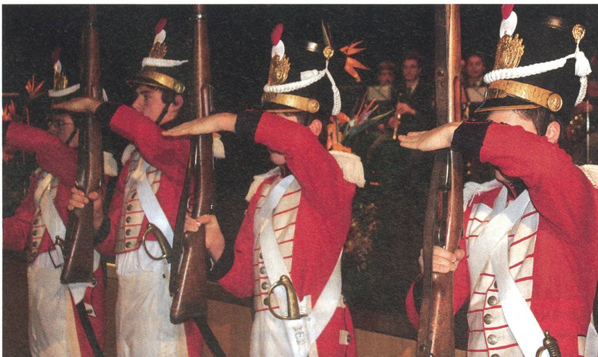
Eine farbenfrohe, historische Bereicherung: Die Cumpagnia da Mats.

Mit eindrücklichen Zahlen wartete Divisionär Fisch auf, was die Diensttage betrifft: «Dank der Arbeit der Koordinationsstelle haben 37 Truppenkörper in unserem Raum Dienst geleistet. Dies bedeutet rund 300 000 Diensttage. Wenn wir noch die