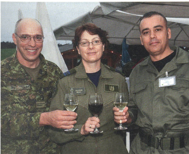
Gäste aus aller Welt zogen Nutzen aus dem Programm.