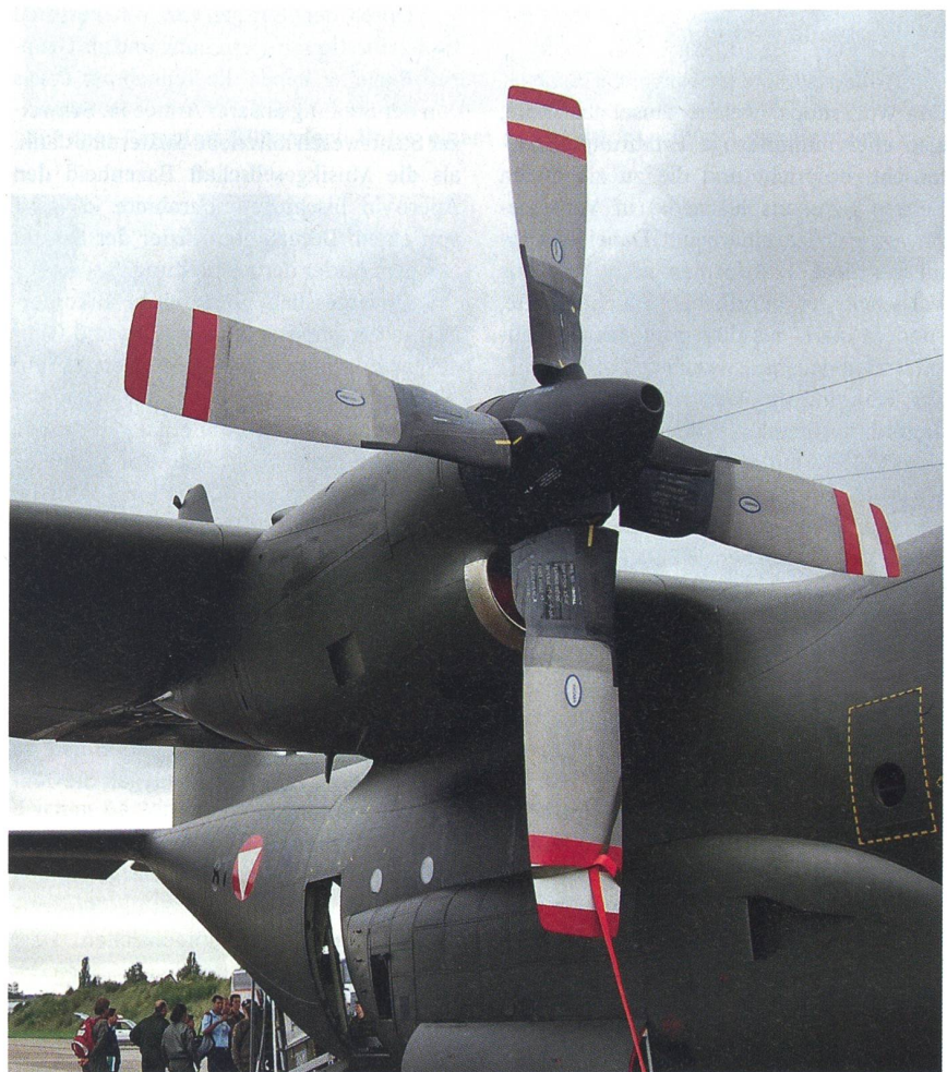
Internationale Luft in Dübendorf: Ein Eindruck von der mächtigen Hercules C-130K.

Für die Fachinhalte war das NATO-Kommando «Air Command Headquarters