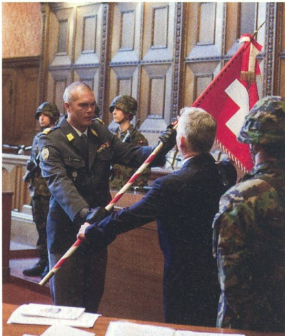
Basel: Das Ende des Panzerbataillons 25.