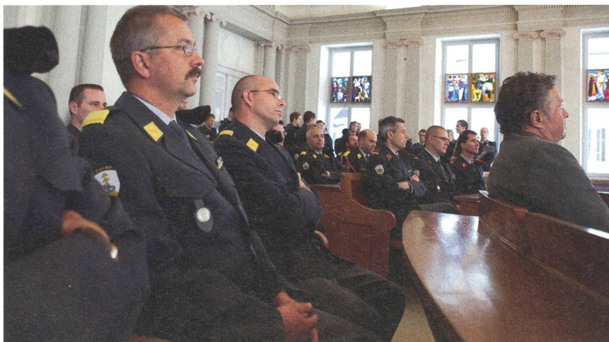
Panzergrenadierbataillon 27 in Glarus: Nachdenkliche Truppen- und Stabsoffiziere.