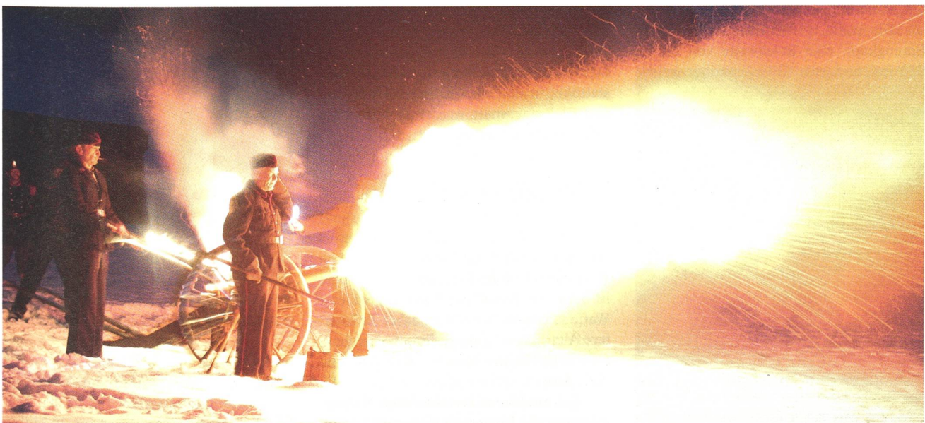
«Zu Ehren der heiligen Barbara, der Schutzpatronin der Artilleristen: Ein Schuss, Feuer frei!»