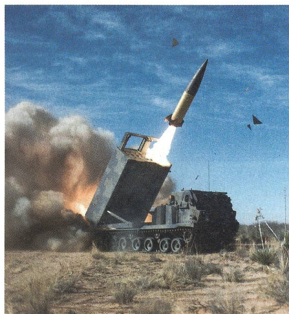
Ein MLRS feuert eine ATACMS ab.

Die Waffe verfügt über einen 250 kg Sprengkopf, eine Reichweite von bis zu 300 km und eine GPS-Lenkung, welche