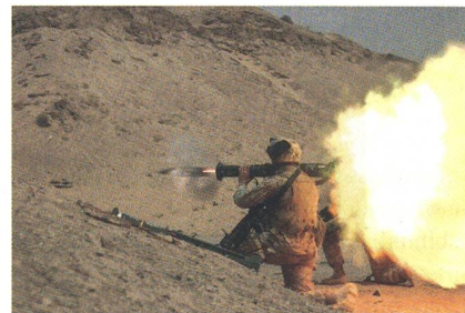
Abschuss einer AT4 Panzerfaust.

Die mit 84 mm kleinkalibrige AT4 vermag zwar die Panzerung moderner Kampfpanzer nicht zu durchdringen, ist jedoch