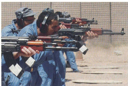
Afghanische Polizisten im Schiesstraining.

Russland hat die Auslieferung von Handfeuerwaffen und Munition an Afghanistan im Rahmen des Militärhilfe-Programms abgeschlossen. Das letzte von insgesamt neun Transportflugzeugen des Typs Il-76 ist